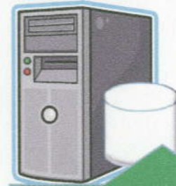
アーカイブサーバー